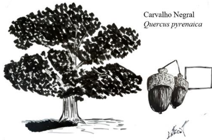
Desafio "A minha árvore nativa"