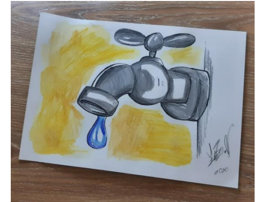
Desafio do Dia da Terra