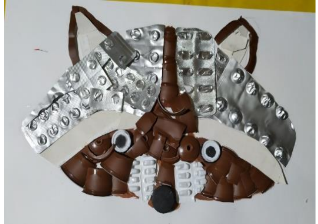
Obras de arte com resíduos