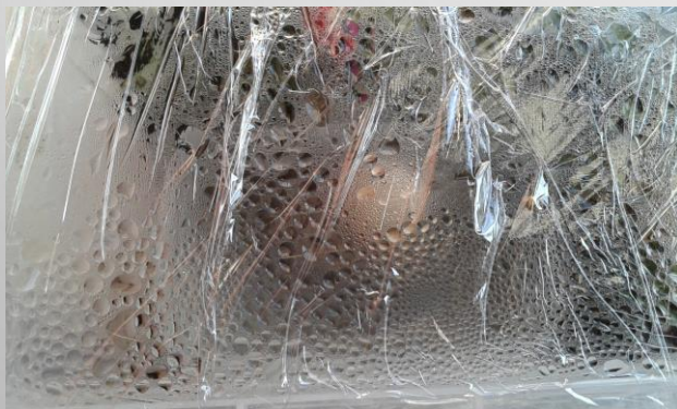
Alice (Escola Básica de Povolide)